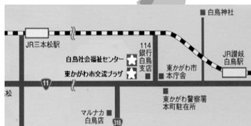
■会場■ 白鳥社会福祉センター (東かがわ市湊 1809 番地)

東かがわ市ファミリー・サポート・センター (東かがわ市社会福祉協議会内) 住所: 東かがわ市湊 1809 番地 TEL: (0879)26-1151 FAX: (0879)26-3016 受付: 月~金 9:00~17:00